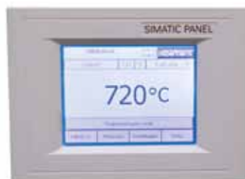
Genauigkeit des Controllers, z.B. +/- 2 °C

Die Messung der Temperaturverteilung erfolgt bei einer vom Kunden vorgegebenen Soll-Temperatur nach einer vorab definierten Haltezeit. Sofern gefordert, können auch unterschiedliche Soll-Temperaturen oder ein definierter Soll-Arbeitsbereich kalibriert werden.